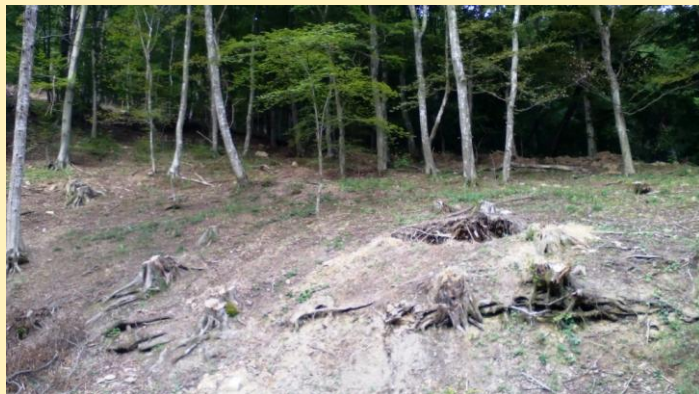
Tăieri de arbori la Gârliște în zona de vecinătate a PN Semenic - Cheile Carașului

Datorită unei slabe reacții din partea autorităților/instituțiilor teritoriale și centrale cu atribuții directe în domeniul stopării tăierilor ilegale de arbori, a unei incoerențe în ultimii 10 ani în implementarea politicilor publice în domeniul protecției naturii din partea factorilor majori de decizie de la nivel central și a unei lipse de atitudine față de tăierile ilegale de arbori în ariile naturale protejate din partea cetățenilor din localitățile plasate în aria parcurilor, agresiunile împotriva patrimoniului natural nu au putut fi stopate în timp.