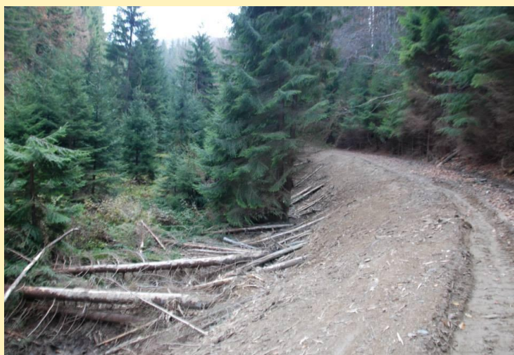
Tăieri de arbori la Gârliște în zona de vecinătate a PN Semenic - Cheile Carașului

Tăierile ilegale sau abuzive de arbori în parcurile naționale Semenic - Cheile Carașului și Cheile Nerei - Beușnița sunt cunoscute la nivelul Ministerului Mediului, Apelor și Pădurilor și a structurilor teritoriale ale acestuia datorită protestelor și notificărilor repetate ale GEC Nera și ale altor ONG-uri precum și a mediatizării acestora în presă. Aceste tăieri de arbori s-au produs datorită lipsei de fermitate a autorităților din structura Ministerul Mediului, Apelor și Pădurilor care ar fi trebuit să impună respectarea de către administratorii de păduri, administratorii de parcuri și operatorii din parchete a Legii Ariilor Naturale Protejate și a Codului Silvic. Din păcate, în unele cazuri, autoritățile au dat senzația că se transformă în „avocați” ai operatorilor care exploatează masa lemnoasă în interiorul parcurilor.