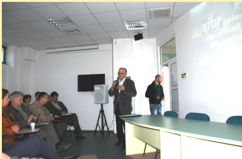
Lansarea concursului de anchete jurnalistice la sediul partenerului APM Caraș - Severin

Implicarea mediei locale în implementarea proiectului s-a făcut în cadrul unui concurs de anchete jurnalistice privind fenomene relevante de tăieri abuzive și ilegale de arbori. Concursul a fost realizat în perioada noiembrie 2014 - iulie 2015 de implementare a proiectului și a constat în încurajarea și premierea de către GEC Nera a aparițiilor în presa scrisă și electronică a știrilor și a anchetelor jurnalistice privind tăierile abuzive și ilegale de arbori. În luna iulie 2015 a fost organizat la sediul APM Caraș - Severin o festivitate de premiere a celor mai bune anchete jurnalistice.