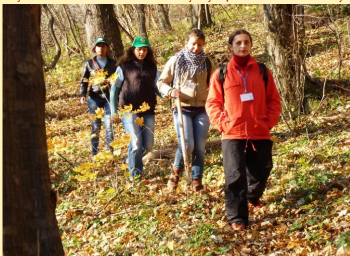
Monitorizarea de către voluntari a tăierilor de arbori pe pârâul Semenic

b) În perioada octombrie - noiembrie 2014 s-a realizat o monitorizare a pădurilor din Parcul Național Cheile Nerei - Beușnița pe teritoriul orașului Oravița, satul Ciclova Montană, în zona și în