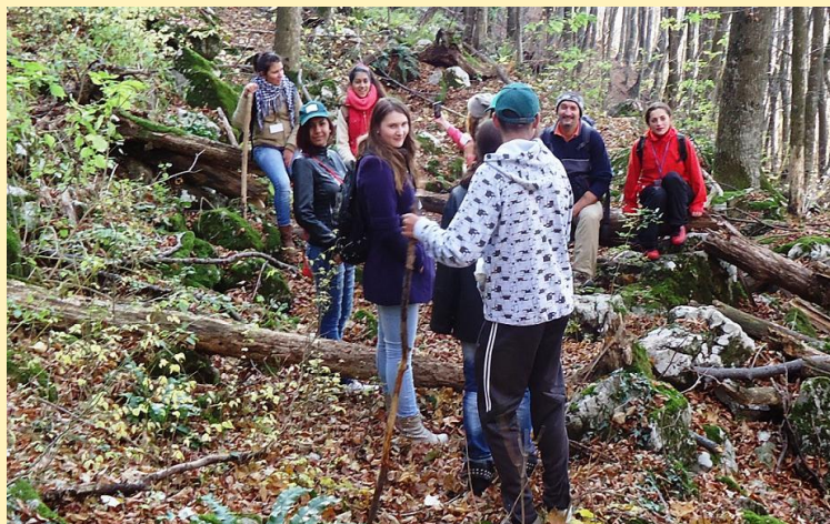
Monitorizarea de către voluntari a tăierilor de arbori în rezervația naturală Valea Ciclovei - Ilidia