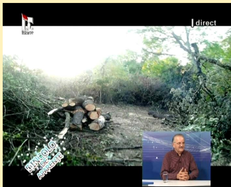
Dezbatere privind tăierile abuzive și ilegale de arbori pe postul Banat TV

Pe perioada concursului au fost difuzate 6 comunicate de presă în momentul producerii unor fenomene relevante de tăieri ilegale de arbori și au fost oferite jurnaliștilor puncte de vedere sub formă de interviuri/participări la mese rotunde precum și informații de natură legislativă cu scopul de a-i sprijini în realizarea unor investigații corecte. În cadrul proiectului a fost realizat și difuzat pe posturile Televiziunii Române și un videoclip promoțional cu o durată de 3 minute, incluzând momentele importante ale implementării proiectului și cazuri relevante de agresioni împotriva pădurilor din zona celor două parcuri.