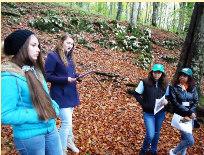
Monitorizarea de către voluntari a tăierilor de arbori în rezervația naturală Buhui - Mărghițaș

printr-o acțiune în cadrul centrului de voluntariat al GEC Nera.